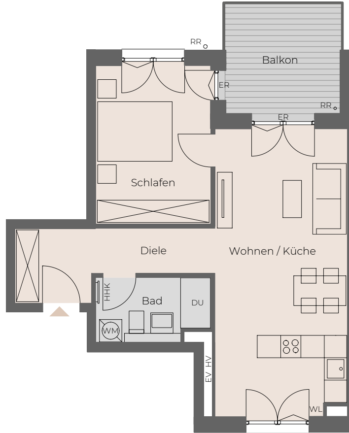
Lüftungstechnisch nicht notwendiges Fenster, nur zu Reinigungszwecken zu öffnen